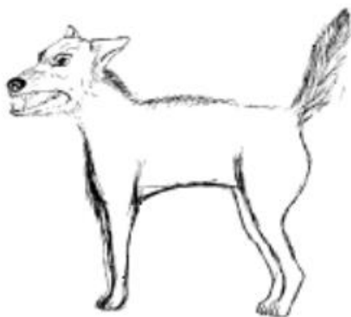
عصباني هستم ، ولم كنيد .