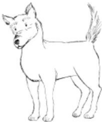
صمیمی و هوشيار هستم .