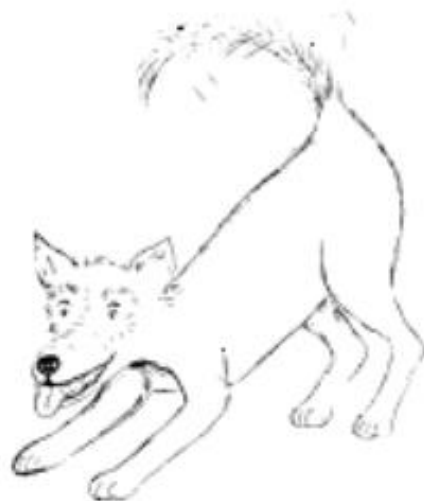
ميخواهم بازي كنم .